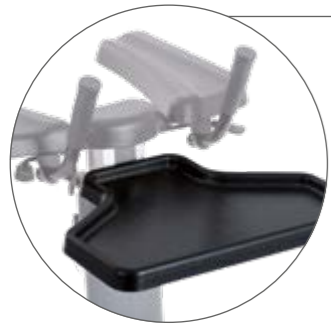
Tablett für den sicheren Transport von Getränken und Essen