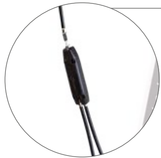
Einhand-Simultanbremse links oder rechts montierbar, zur Einhandbedienung