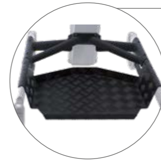
Transportplatte zur Unterstützung beim Personentransport, wenn der Nutzer müde ist