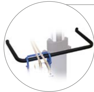
Halterung für Drainagebeutel