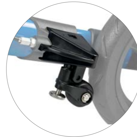
Rollwiderstand-System (RWS) unterhalb des Kantenabweisers montiert.

Dieses wird ober- oder unterhalb des Kantenabweisers am Rad angebracht und ist über das Einstellrädchen stufenlos verstellbar. So kann der Widerstand des Rollators individuell an die Bedürfnisse des Nutzers angepasst werden – immer so, dass der Nutzer den optimalen Widerstand erhält, um sicher und gleichmäßig gehen zu können.