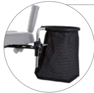
Multifunktionsnetz Zusatzablage im Handgriffbereich, einfach Kleinteile verstauen, bis 2 kg belastbar