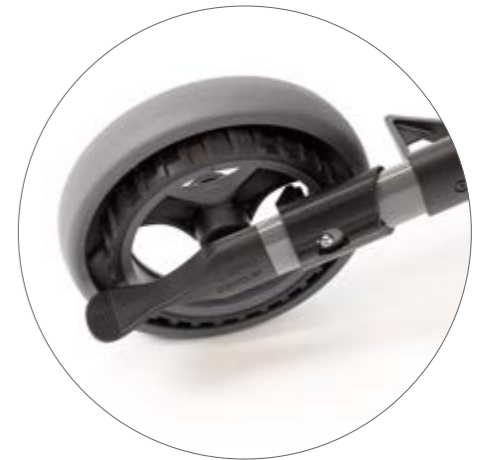
Der Kantenabweiser und das reversible Bremssystem (RBS) erleichtern den Alltag. Dauerhaft gebremst; zum Gehen ziehen/zum Halten loslassen.