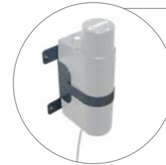
Wandhalterung für Batterieladegerät (Concens)