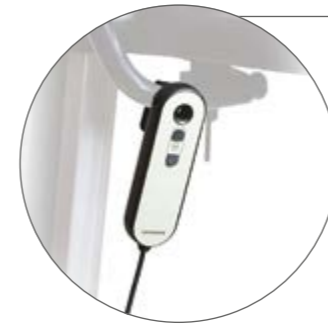
Fernbedienung für TOPRO Taurus E